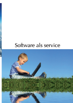
Software als service