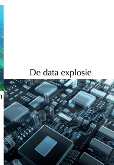
De data explosie